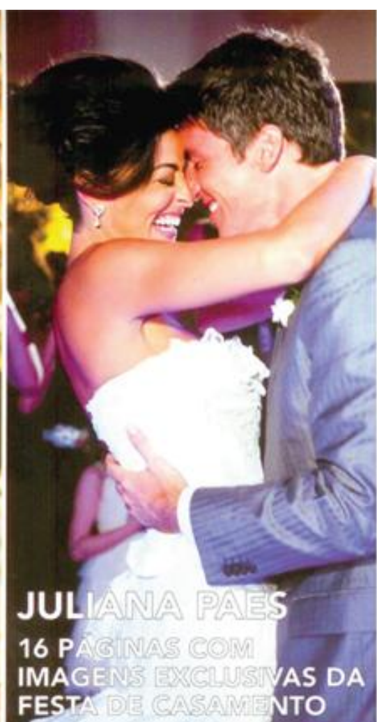
JULIANA PAES 16 PÁGINAS COM IMAGENS EXCLUSIVAS DA FESTA DE CASAMENTO