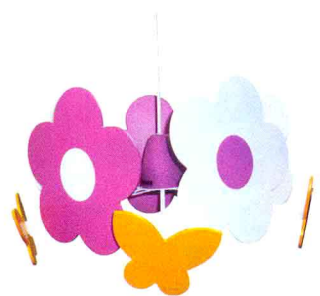
AMOEDO , R$257,90, TEL.: (21) 2287-7000, AMOEDO.COM.BR