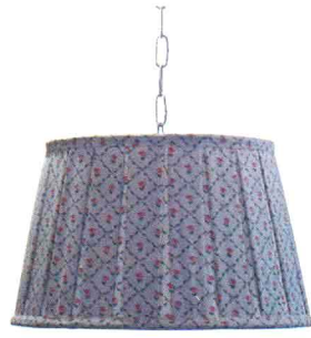
CELINA DIAS BEBÊ , R$796, TEL.: (11) 2893-6846, CELINADIASBEBE.COM.BR