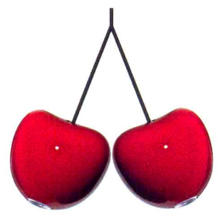
LA LAMPE , R$15.986, TEL.: (11) 3069-3949, LALAMPE.COM.BR