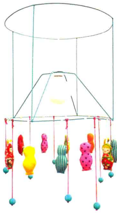
ZEBRAS , R$295, TEL.: (21) 3495-7656, ZEBRAS.COM.BR