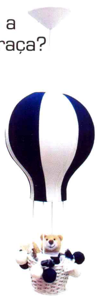
GMONO , R$430, TEL.: (21) 2239-9915, GMONO.COM.BR