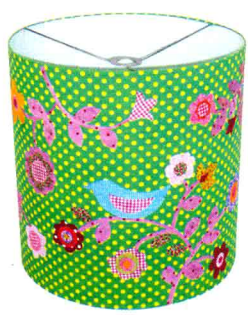
OBA! ARQUITETURA , R$720, TEL.: (11) 2529-8194, OBAARQUITETURA.COM.BR