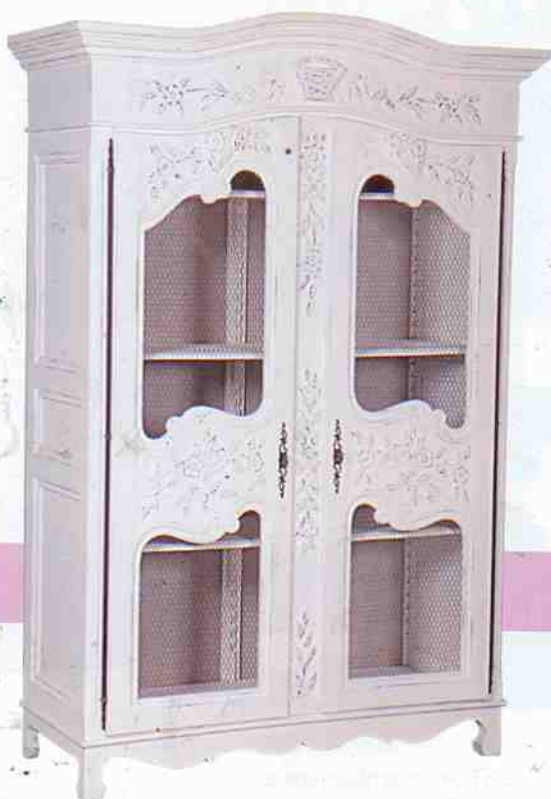
O armário Mariage tem portas inteiriças com telas, fechaduras em bronze, ferragens em ferro nas laterais, entalhes na madeira e pintura provençal (Alt.: 215 cm; Larg.: 146 cm; Prof.: 58 cm). Secrets de Famille, R$ 14.146.