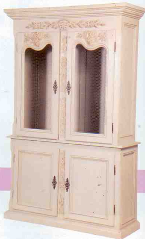
A Biblioteca Mariage possui tela nas portas superiores, ferragens importadas da França, fechadura em bronze e acabamento na cor Mastic (Alt.: 220 cm; Larg.: 140 cm; Prof.: 46 cm). Secrets de Famille, R$ 12.432.