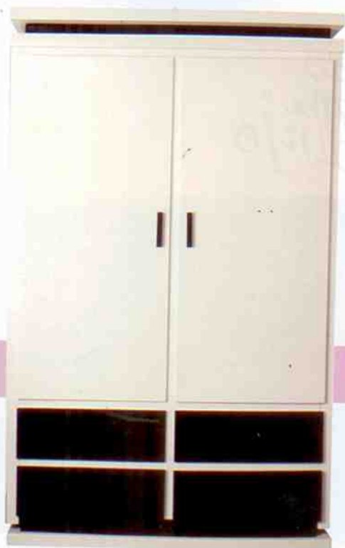
De madeira maciça, o guarda-roupa mescla em suas linhas retas as cores branca e preta em pintura automotiva (Alt.: 212 cm; Larg.: 130 cm; Prof.: 46 cm). BBTrends, R$ 7.850,79.