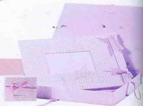
Conjunto de álbum e bloco de anotações revestidos de tecido com laços de fita, acomodados em caixa forrada. Cantos de Anjo, preço sob consulta.