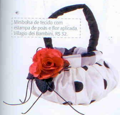
Minibolsa de tecido com estampa de poás e flor aplicada. Villagio dei Bambini, RS 32.