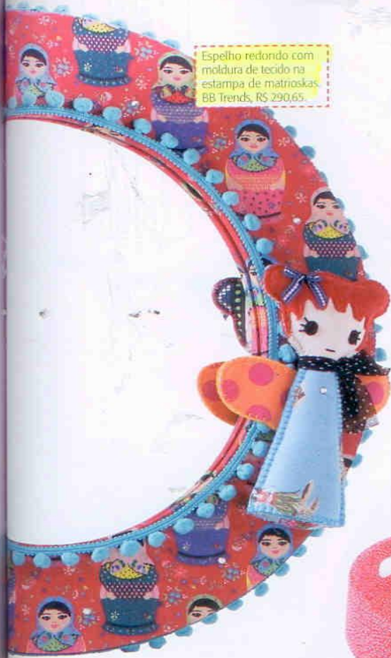
Espelho redondo com moldura de tecido na estampa de matrioskas. BB Trends, R$ 290,65.