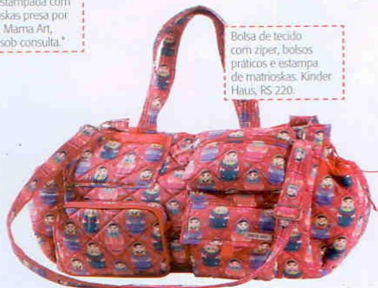
Bolsa de tecido com zíper, bolsos práticos e estampa de matrioskas. Kinder Haus, R$ 220.