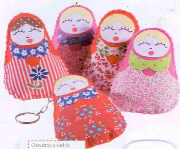
Chaveiros e sachês de algodão em forma de matrioskas. Mama Art, preço sob consulta.