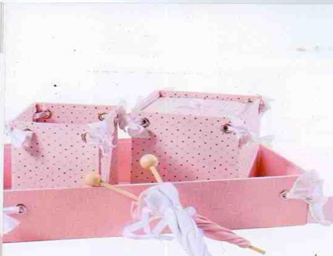
Kit de higiene com bandeja de madeira, potes de tecidos e detalhe de miniguaiá-chuva de tecido. Lu Martinez, preço sob consulta.