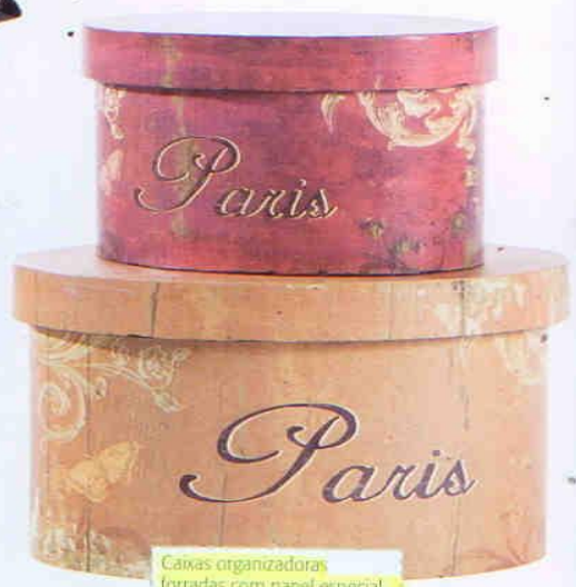
Caixas organizadoras forradas com papel especial envelhecido. BB Trends, preço sob consulta.