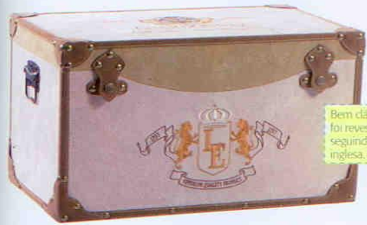
Bem clássico, o baú de madeira foi revestido com tecido especial, seguindo toda a padronagem inglesa. BB Trends, R$ 1.231,92.