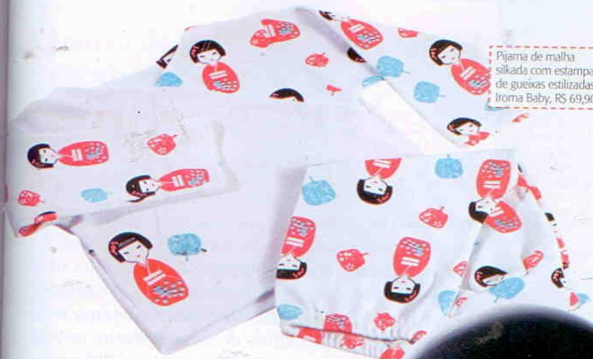
Pijama de malha silkada com estampa de gueixas estilizadas. Iroma Baby, R$ 69,90.