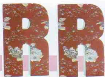
Letra revestida de tecido floral e confeccionada de material bem leve para ser aplicada à parede. Mede 25 x 13 cm. Atelier RA, preço sob consulta.