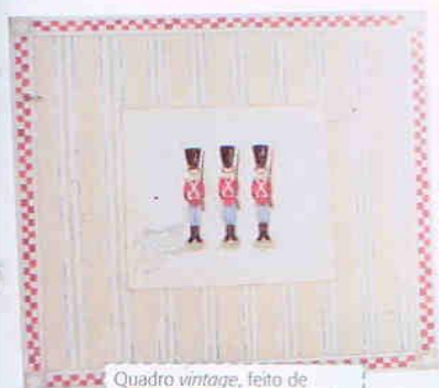
Quadro vintage, feito de madeira com pintura especial. Mede 40 x 40 cm. Ri-Pô-Pi, preço sob consulta.