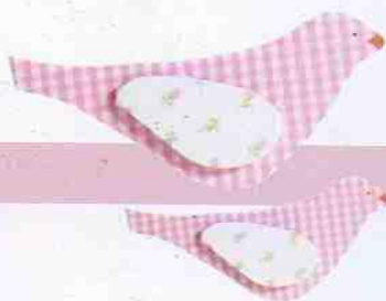
Pendant de pássaros de madeira revestida de tecido. Atelier RA, preço sob consulta.