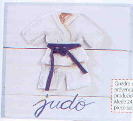
Quadro de madeira com pintura provençal e aplique de quimono produzido em papel machê. Mede 24 x 24 cm. Lu Martinez, preço sob consulta.