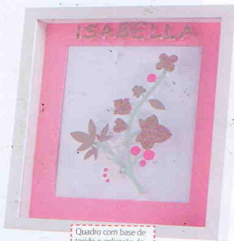
Quadro com base de tecido e aplicação de flores de tecido em 2-D. Belle Petit, preço sob consulta.