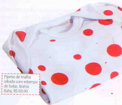
Pijama de malha silkada com estampa de bolas. Iroma Baby, R$ 69,90.