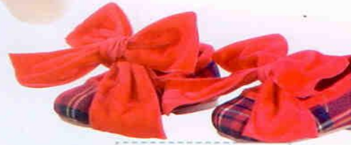
Par de sapatinhos femininos com estampa xadrez e laço de veludo vermelho. Quarto de Lua, R$ 85.