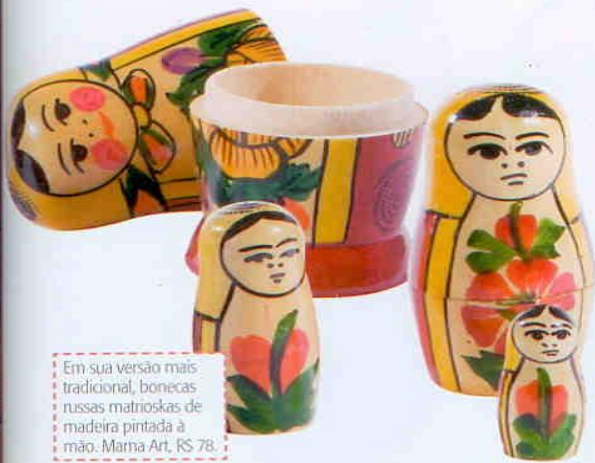
Em sua versão mais tradicional, bonecas russas matrioskas de madeira pintada à mão. Mama Art, R$ 78.