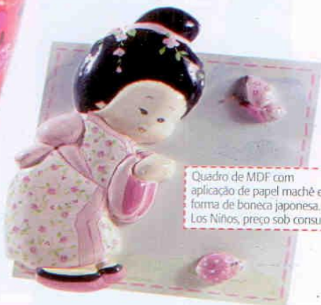
Quadro de MDF com aplicação de papel machê em forma de boneca japonesa. Los Niños, preço sob consulta.