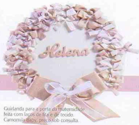
Guirlanda para a porta da maternidade feita com laços de fita e de tecido. Camomila Baby, preço sob consulta.