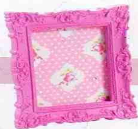
Moldura moderna que combina o estilo provençal e as cores fortes, com fundo de tecido aplicado. Disponível em diferentes cores e modelos. BB Trends, R$ 148.