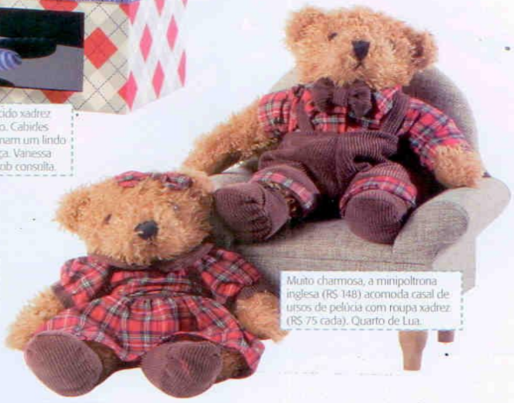
Muito charmosa, a minipoltrona inglesa (R$ 148) acomoda casal de ursos de pelúcia com roupa xadrez (R$ 75 cada). Quarto de Lua.