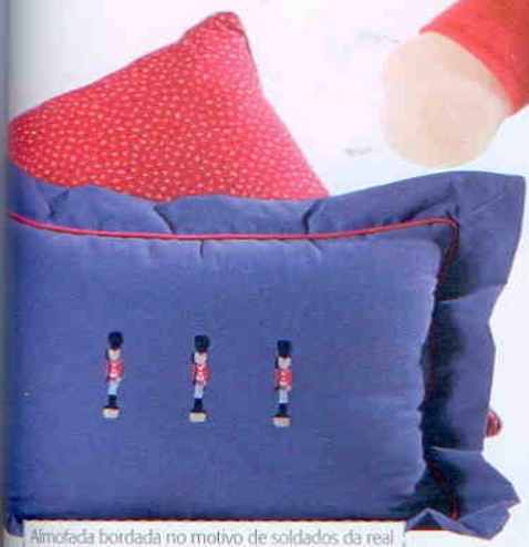
Almofada bordada no motivo de soldados da real guarda britânica. Mede 28 x 32 cm (R$ 115). A peça faz uma bela composição com a almofada vermelha. Ri-Pô-Pi, preço sob consulta.