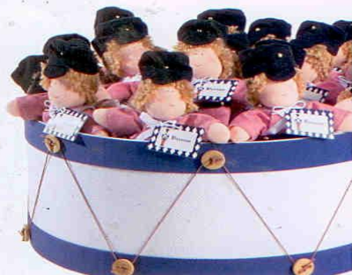
Caixa revestida de tecido com aplicação de fios encerados e botões. Em forma de tambor, acomoda miniboncos soldados, feitos de feltro para lembrancinhas. Bavette, preço sob consulta.