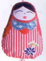
Pendânt de cortina com flor, coração e matrioskas de tecido bordado. Mama Art, preço sob consulta.