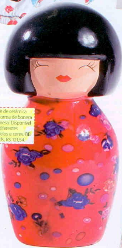
Cofre de cerâmica em forma de boneca japonesa. Disponível em diferentes modelos e cores. BFF Trends, R$ 121,54.